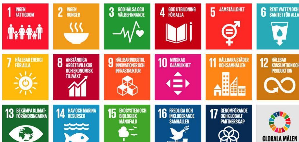
Figur 1 Bilden visar FN:s 17 hållbara utvecklingsmål som även benämns om Agenda 2030

Boråsregionen Sjuhärads kommunalförbund bildades 1999 och är ett politiskt styrt samverkansorgan. Medlemskommunerna är Bollebygd, Borås, Herrljunga, Mark, Svenljunga, Tranemo, Ulricehamn och Vårgårda. Varbergs kommun är adjungerad till förbundet enligt särskilt avtal. I projektet ingår kommunerna Bollebygd, Borås, Herrljunga, Mark, Svenljunga, Tranemo, Ulricehamn och Vårgårda.