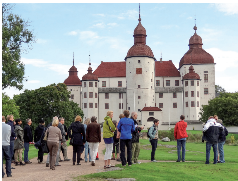
Kulturarvet lockar turister. Läckö slott på Kållandsö i Vänern har över 300 000 besökare årligen.

En fullständig redovisning av samtliga näringsverksamhetskoder (SNI-koder) och de koefficienter som använts i de olika beräkningarna redovisas i bilaga 1. En mer detaljerad redovisning av samtliga beräkningar finns i ESPON-studiens slutrapport 13 .