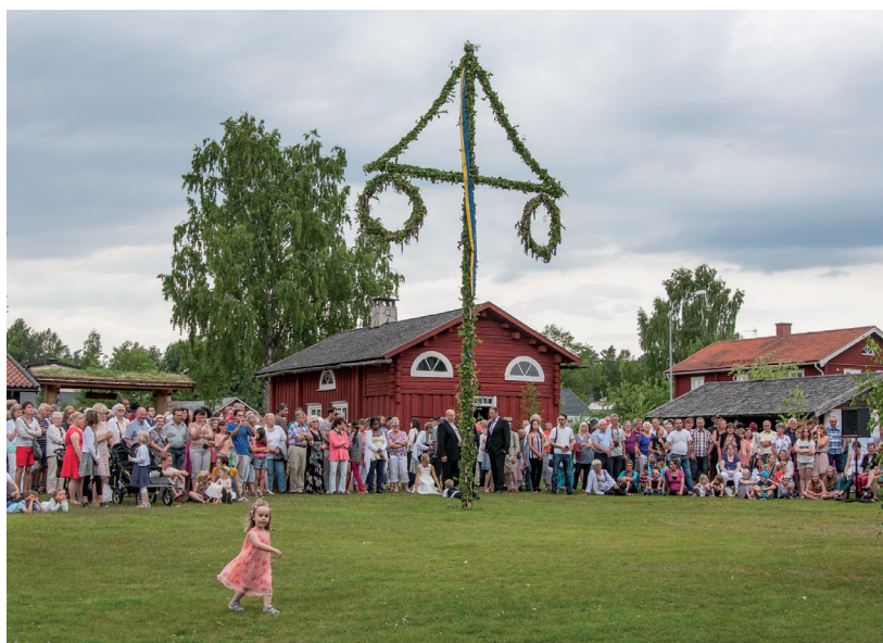
Sveriges drygt 2 000 hembygdsföreningar arrangerar årligen över 30 000 evenemang som är öppna för allmänheten. Det är ett arbete som till största delen utförs av ideella krafter.

Till sist bör värdet av de olika ideella krafter som verkar för att bevara och underhålla kulturarvet lyftas. Studien visar att ideellt kulturarvsarbete genomförs motsvarande ett uppskattat värde på cirka 500 miljoner kronor enbart i Sverige. Sett till samtliga deltagande länder innebär ideellt lagda timmar ett monetärt uppskattat värde på drygt 170 miljoner euro årligen. Det här är ideella krafter som i sin tur stöttar de näringsverksamheter som är beroende av att kulturarvet vårdas och underhålls. En äldre industrimiljö kan till exempel locka många besökare och vara viktig för en regions besöksnäring genom att ett arbetslivsmuseum vårdar och tillgängliggör den.