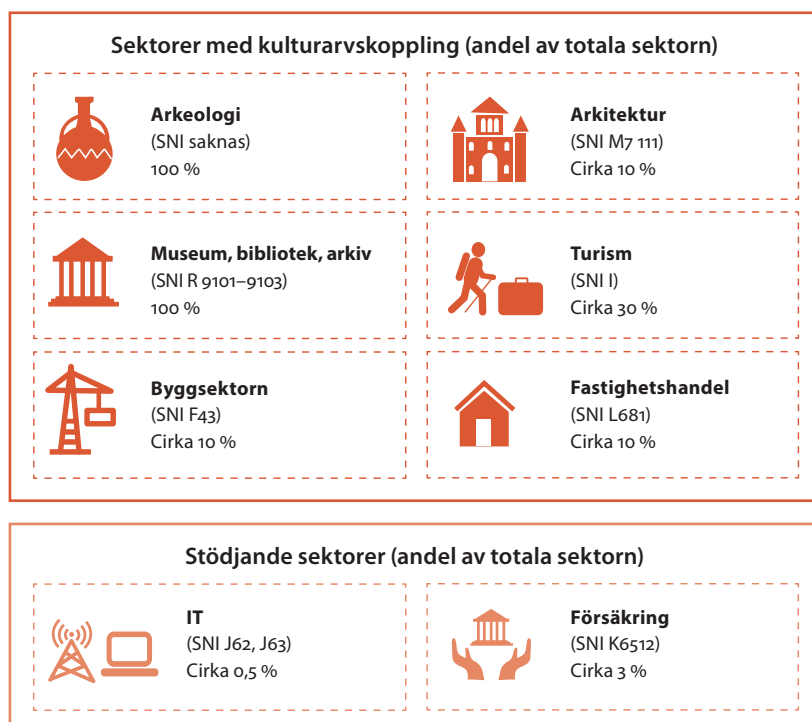
Figur 3: Redovisning av kulturarvets ekonomiska påverkan på de undersökta näringsverksamheterna år 2016. Siffrorna visar ett genomsnittligt värde för samtliga studerade länder (Sverige, Belgien, Österrike, Italien, Norge, Slovenien, Slovakien, Portugal, Rumänien och Holland).

I figur 3, som hämtats från ESPON-studien, redovisas kulturarvets procentuella påverkan inom respektive näringsverksamhet. Siffrorna är ett genomsnitt för de länder som ingått i studien och bygger på data från 2016.