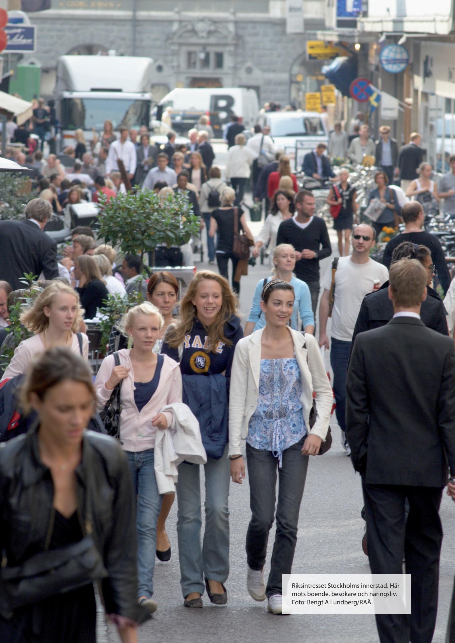
Riksdagstret i Stockholms innerstad. Här möts boende, besökare och näringsliv.