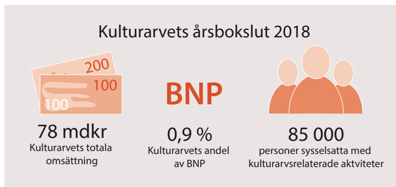
Figur 1: Illustration med nyckeltal för kulturarvets påverkan i Sverige under 2018.

Genom studien kunde en gemensam metod utvecklas för att beräkna kulturarvets ekonomiska effekter inom olika näringsverksamheter. Det gäller exempelvis besöksnäringen, reparationer och underhåll av den äldre bebyggelsen, arkiv, museum och bibliotek men även värdet av de ideella krafter som utförs av till exempel hembygdsföreningar och arbetslivsmuseer.