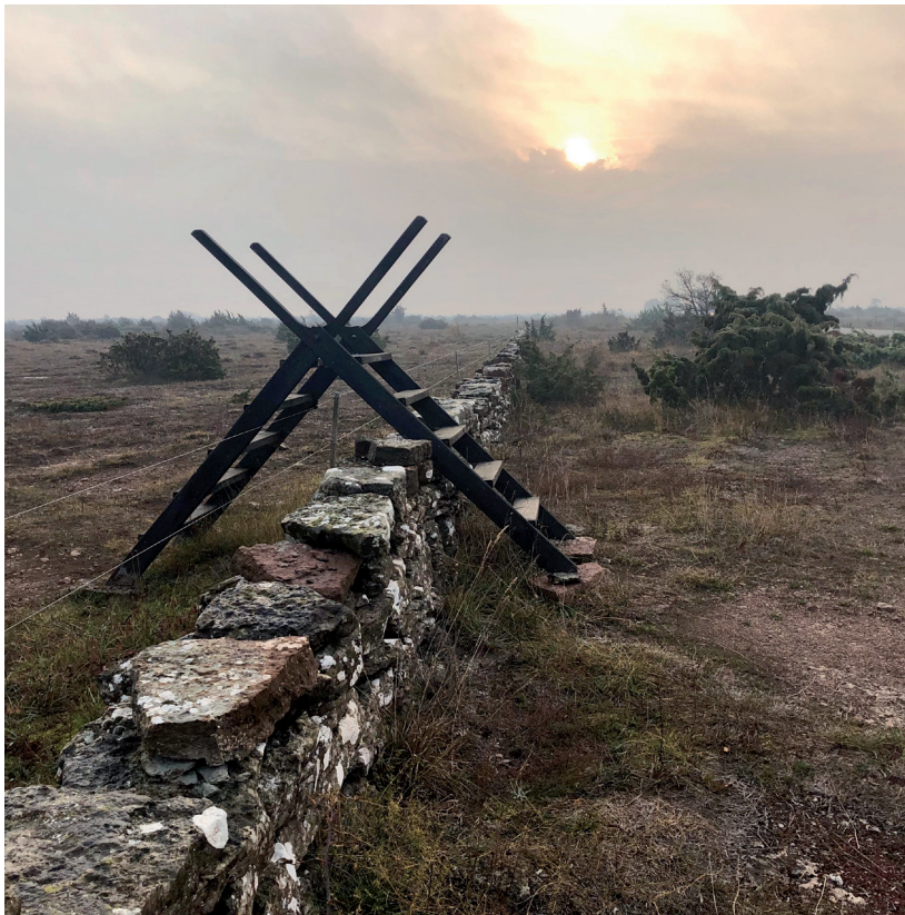
Södra Ölands odlingslandskap är ett biologiskt kulturarv där samspelet mellan människa, djur och natur skapat unika biologiska värden.

Resultatet från ESPON-studien visar att det är möjligt att beräkna kulturarvets ekonomiska påverkan. Genom studien har det också varit möjligt att identifiera brister i befintligt dataunderlag, behov av fortsatt metodutveckling och önskemål om framtida datainsamling. Till exempel borde de undersökningar som görs på utländska turisters resande även appliceras på inhemska turister som reser inom landet. De som tillfrågas borde även få möjlighet att rangordna de olika svarsalternativen, vilket skulle öka tillförlitligheten i fortsatta beräkningar.