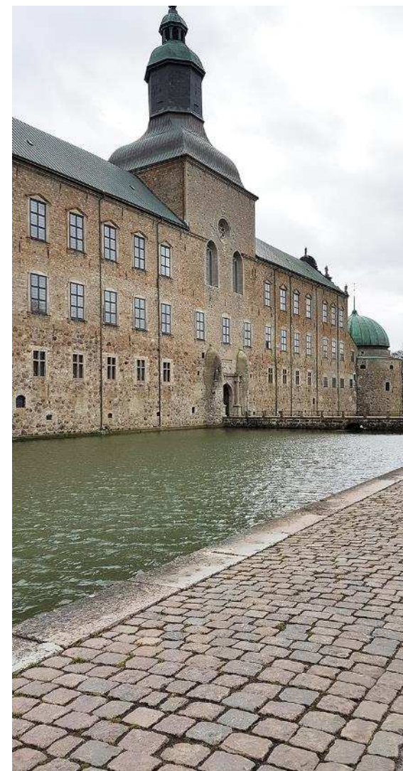
Riksarkivet i Vadstena, foto Helena Långström