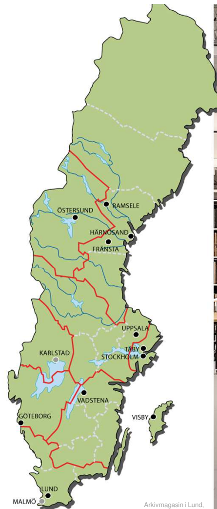
Arkivmagasin i Lund