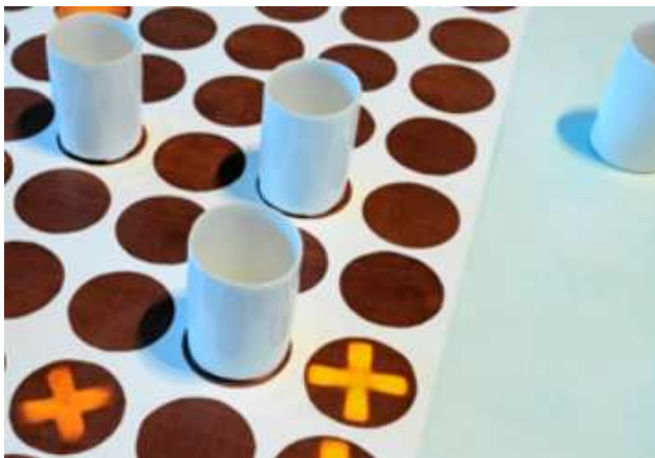
Duk som byter mönster: Duken är tryckt med termokromatiska färger som förändras av temperatur.. Ställs en varm kaffekopp på duken ändras mönstret. Design: Linda Worbin

Inom området kultur kommer arbetet under 2011 kommer att lyfta fram intentionerna i tagna handlingsprogram (1/ Barn och Ungdomars kultur, 2/ Lust att lära, kulturen som kraftkälla i det livslånga lärandet samt 3/ Utvecklingsplan för det maritima och industrihistoriska kulturarvet) men framförallt fokusera och lyfta fram igångsatta samarbeten mellan delregionerna i Västra Götaland. Primärt handlar dessa samarbeten om kulturutveckling kopplad till barn men också frågor kring lokalt föreningsliv. Ett av målen är att skapa en ökad attraktionskraft där kulturen fungerar som hävstång. Visionen är att bygga gränsöverskridande nätverk som länkar samman aktörer inom utbildning, kultur, näringsliv, offentlig sektor, politik och civilsamhälle.