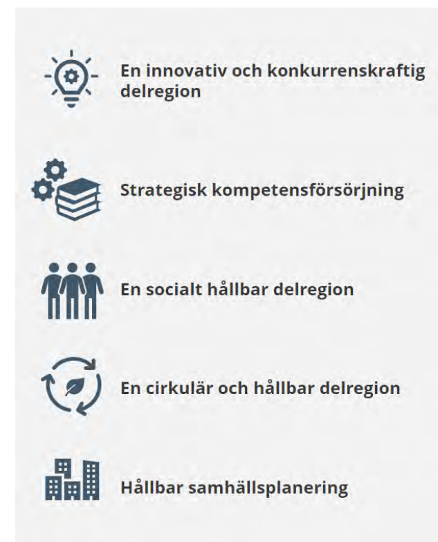
Utvecklingsstrategins fem fokusområden

Rapportering: Uppföljning och rapportering sker vid enhetsmötena i april, augusti och december inför delårsbokslut och årsbokslut.